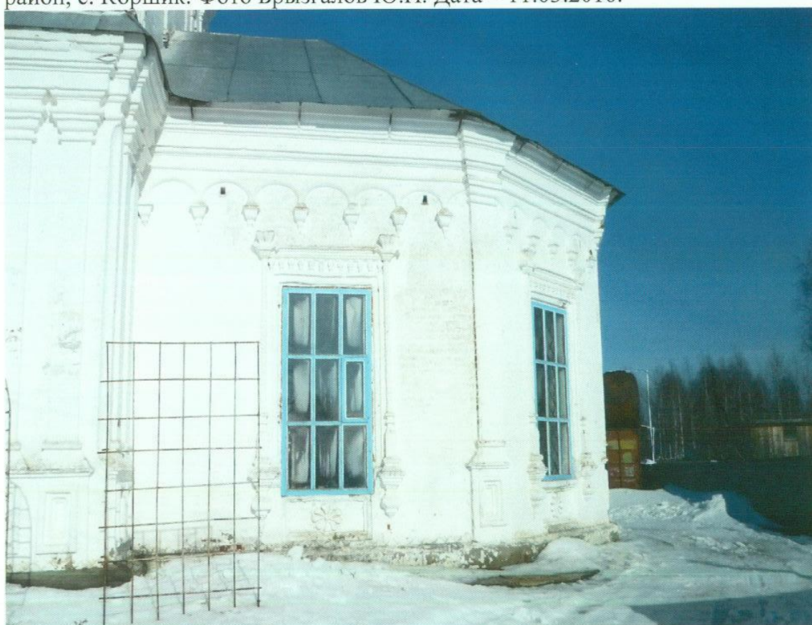
Фото 5. «Зосимо-Савватиевская церковь», Кировская область, Оричевский район, с. Коршик. Дата – 11.03.2016.