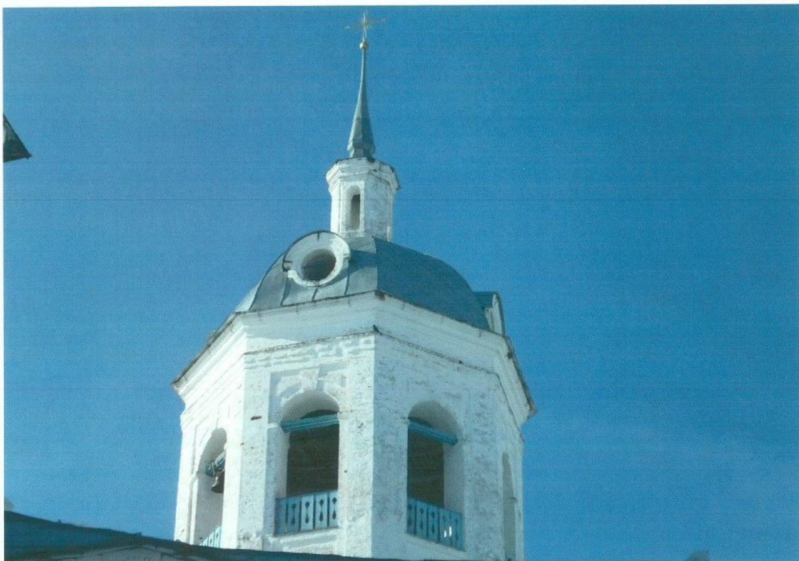
Фото 4. «Зосимо-Савватиевская церковь», Кировская область, Оричевский район, с. Коршик. Дата – 11.03.2016.