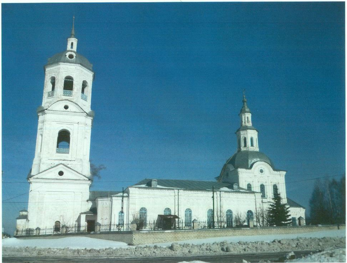
Фото 1. «Зосимо-Савватиевская церковь», Кировская область, Оричевский район, с. Коршик. Дата – 11.03.2016.