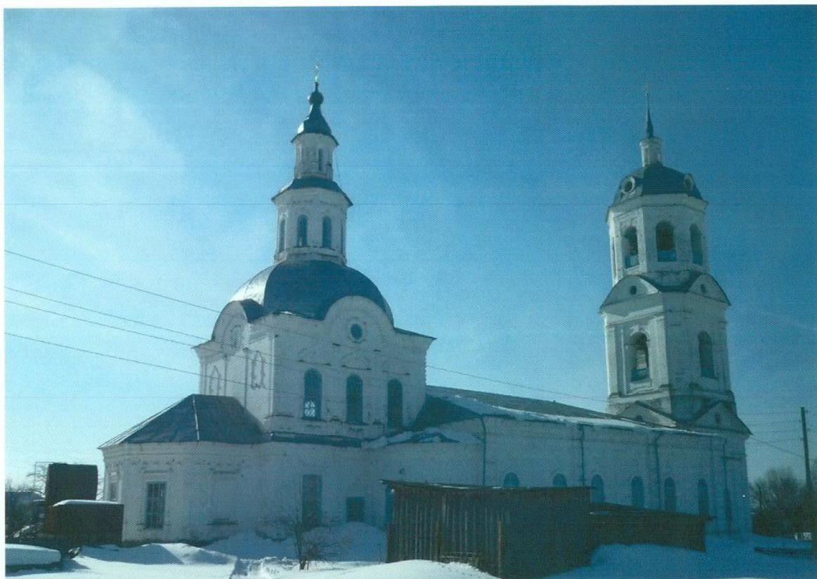
Фото 2. «Зосимо-Савватиевская церковь», Кировская область, Оричевский район, с. Коршик. Дата – 11.03.2016.